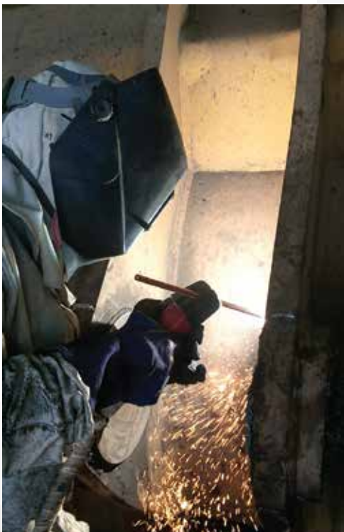
Reparación de Pala/ Minera Michilla

Realizamos diversos tipos de obras civiles industriales aportando de manera integral con los requerimientos de nuestros clientes, garantizando tanto la seguridad de las personas, el cuidado permanente del medioambiente y el cuidado de los activos físicos del cliente