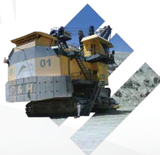
Pala P&H / Minera Esperanza