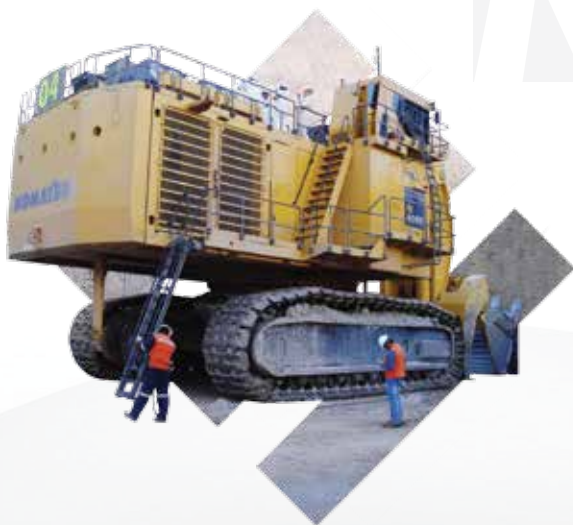
Pala Komatsu / Minera Esperanza

Se realizan reparaciones estructurales, previo análisis de fisuras, por medios tintas penetrantes, también se realizan trabajos de reparación de piezas y estructuras metálicas menores.