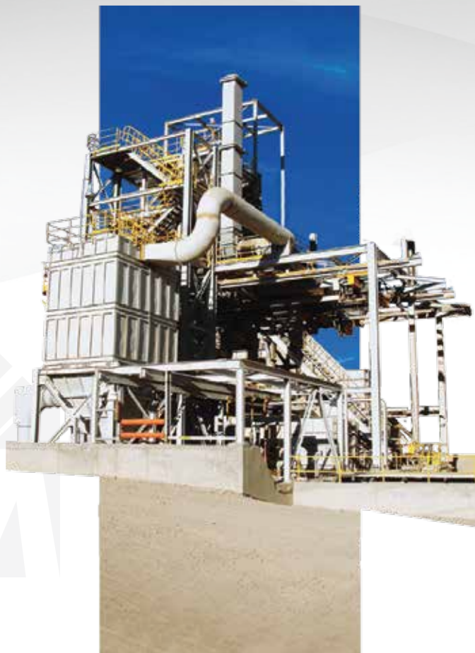
Planta preharneado chancado primario / Minera Zaldivar

A través del monitoreo permanente de kpi's como disponibilidad, utilización, MTBF, MTTR y Producción, podemos concluir que hemos contribuido activamente en beneficio del negocio de nuestros clientes.